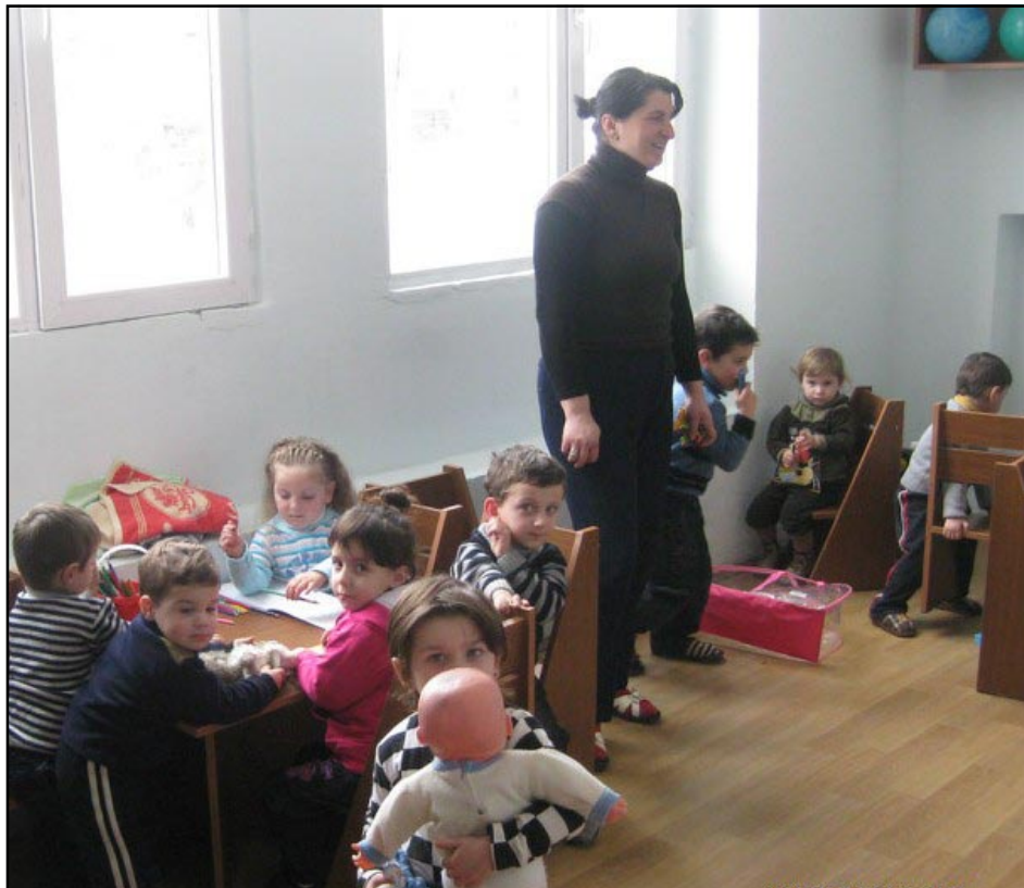
ფოცხო-ენერჯის მოსახლეობის მოთხოვნით, წალენჯიხის მუნიციპალიტეტის 2012 წლის ბიუჯეტში გათვალისწინებულ იქნა დასახლებაში საბავშვო ბაღის გახსნა. ფოცხო-ენერჯი ქსელ „სინერჯის“ წარმომადგენელი ორგანიზაციის - „საუნჯის“